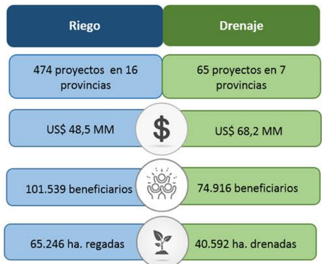
Proyectos ejecutados por los GAD provinciales en el 2018