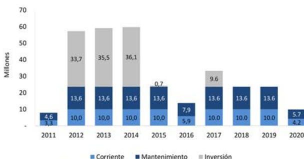
Transferencias a los GAD provinciales por concepto de la competencia de riego y drenaje, 2011 - 2020 (millones US$)

En el período 2011-2020 se ha transferido un monto total de US$ 312,63 millones a los GAD provinciales.